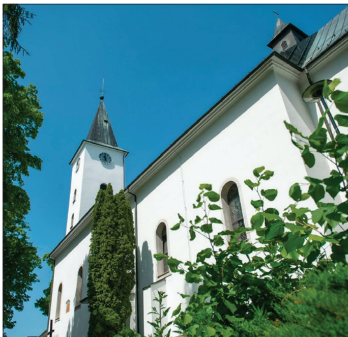
Farní kostel Námestovo

Je zajímavé, že lidé, kteří ještě nezažili osobní setkání s Bohem nechápu proč pláčou; Říkají, že se jim to nikdy nestalo. Je to sám Ježíš, kdo se jich dotýká. Vše co musíme udělat, je jen udělit náš souhlas Například mu říci: « Ježíši, můžeš se posadit tady a mluvit... »